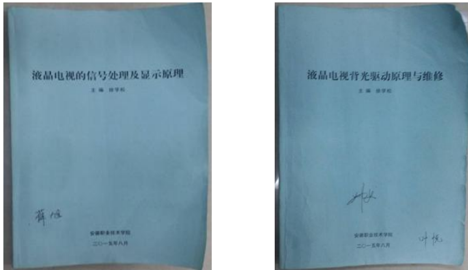
图 1 校企合作教材建设