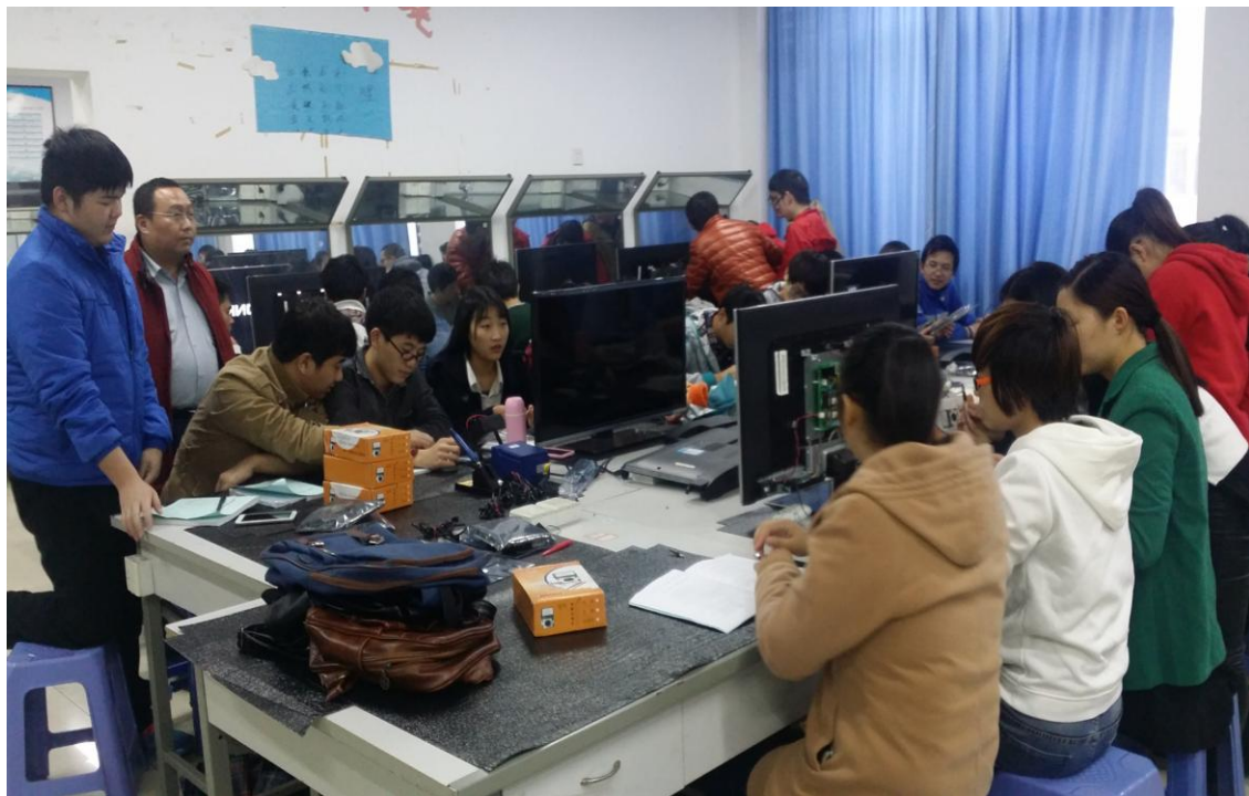
图 2 企业工程师教学现场